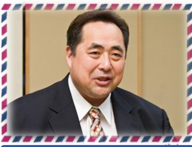
芝田山親方 第六十二代横綱・大乃国 日本相撲協会副理事 スイーツ親方の名前で甘党 美食家としても活躍中

ふれあいすもう体験の後は長居ユースホステルで、力士の作ったあったかい「ちゃんこ鍋」も参加者全員にふるまいます！ふるってご参加ください！